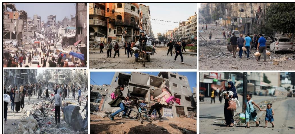
شکل ۲. نمونه ای از بحران در فضاهای شهری غزه